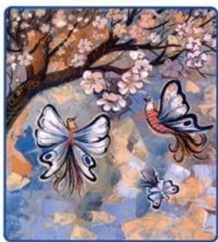
ПОЛІТ СПІВОЧОГО КАМІННЯ

Твір Дмитра Кешелі "Політ співочого каміння" – перша трилогія в закарпатській літературі за роки незалежної України, це історія Закарпаття 20-го ст., другої половини, побачена і пережита самим автором. Персонажі творів надзвичайно колоритні, упізнавані, мудрі, які живуть на перехресті всіх доріг цивілізації народів і культур. Трилогія наповнена гумором і сатирою. Це сміх крізь сльози!