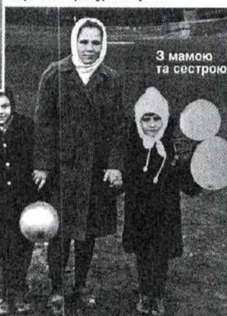
З матір'ю та сестрою