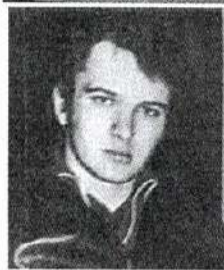
У молоді роки

гнали зі Спілки (письменників, – прим. авт.), що ти став алкоголиком і наркоманом». Думав, вона видумує. Але ні – сусіди підтвердили. День вона мене гризла, бо повірила тому мудаку. То хтось від депутата якогось приїздив. Видно, в моїх грехох себе пізнають, тепер мені на горло хочуть наступити» (2010).