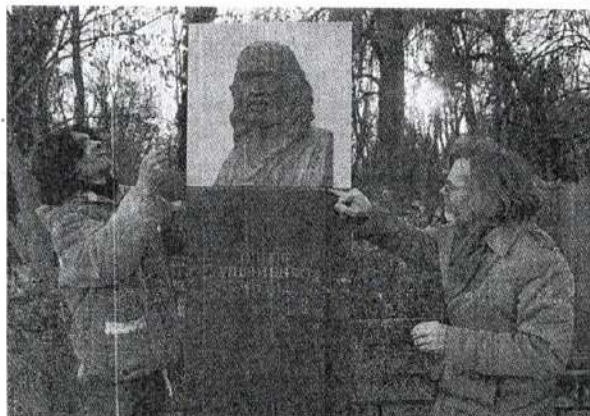
Надгробний пам'ятник на Байковому кладовищі в Києві