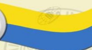
Прапор УНР часів правління Д. Григорівського *