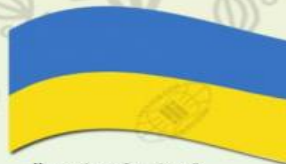
Під керівництвом Стрийської ліскової ради офіційно підняти жовто-блакитний прапор