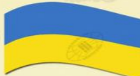
Що час революційних подій українці Галичини використовували синьо-жовтий стяг як національний прапор