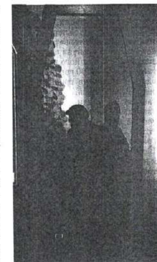
Скульптура київського майстра Івана Зноби