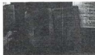
«Народний філософ-учитель Г.С. Сковорода його життя та діла» Григорія Тисяченка (1922 рік)