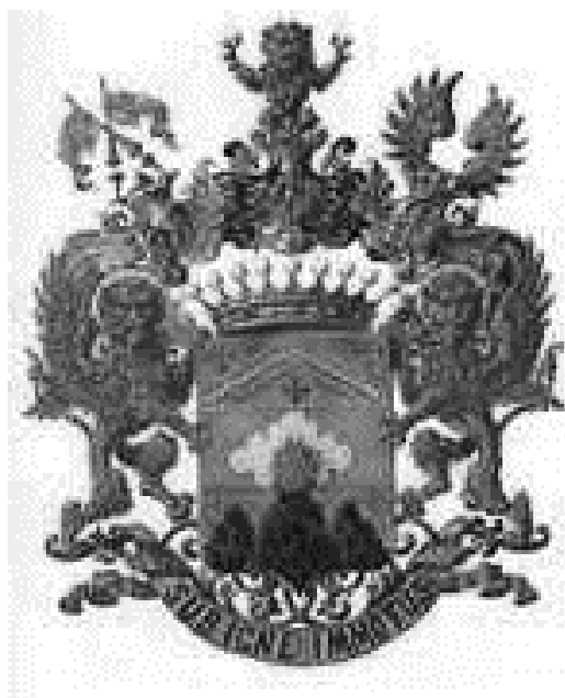
Родовий герб гілки Капністів

Герб Капністів був складений ще до переселення в Росію, коли рід називався Капніссіс. Він має форму класичного геральдичного щита, який пофарбований в золотистий колір і перетинається блакитною лінією. У верхній частині щита зображено два мечі направлені своїми наконечниками один до одного. У нижній частині зображені три чорних гори, з вершини центральної вивергається полум'я. Композиція доповнюється трьома блакитними хрестами у верхній частині щита. В якості щитоутримувачів були використані леви Святого Марка. Над щитом видно графську корону і три графських шоломи, в центрі герба розташований золотистий лев. Герб уособлює стійкість і силу, і, саме ці якості не раз були доведені представниками цього графського роду.