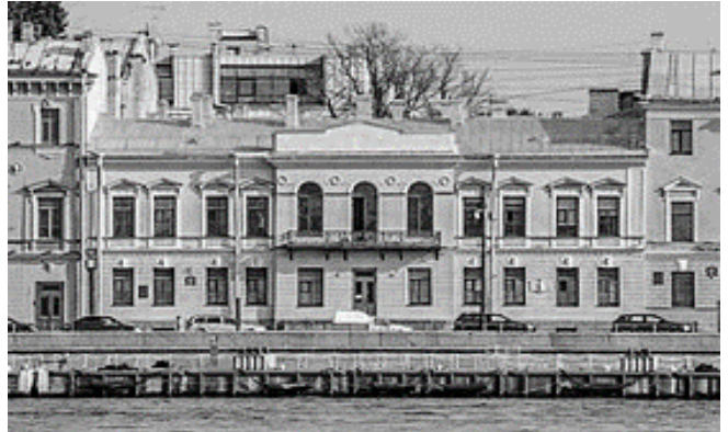
Будинок Капністів на Англійській набережній у Санкт-Петербурзі