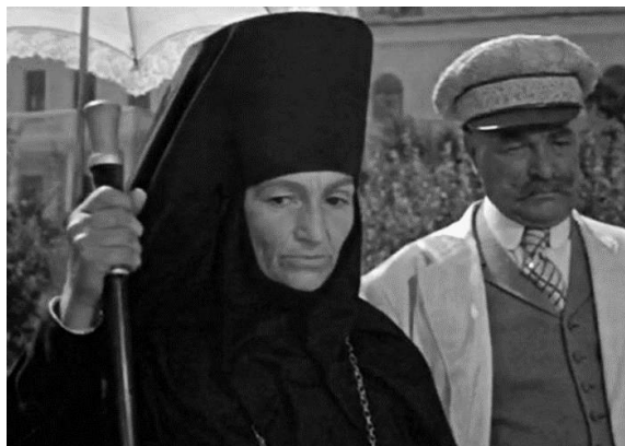
Роль матері Лукер'ї в фільмі "Таврія", 1959 рік.