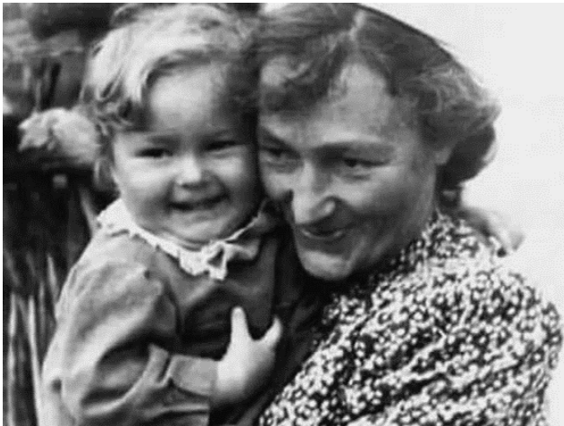
З маленькою донькою.