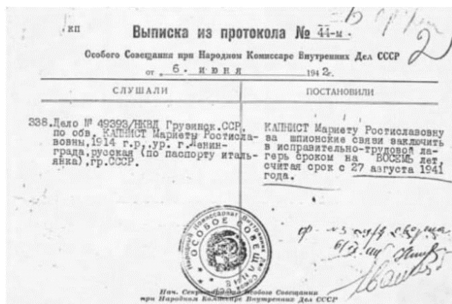
Выписка із протокола № 44 -м

років ВТТ – виправно-трудова таборів. Тоді вона ще не знає, що в таборах їй доведеться провести майже вдвічі більше – 15 років.