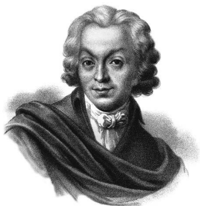
Василь Васильович Капніст (23.02.1758-09.11.1823)