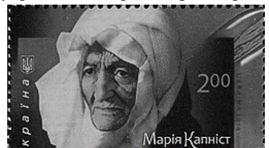
Поштова марка України, випущена до 100-річчя від дня народження М. Капніст, 2014 рік.