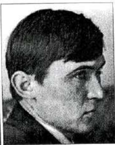
Борис ЧП Член Національної спілки письменників України