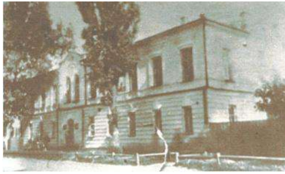
Лубенська фельдшерсько-акушерська школа

Навчання, спілкування з друзями притупили пережиті страхи і сльози: