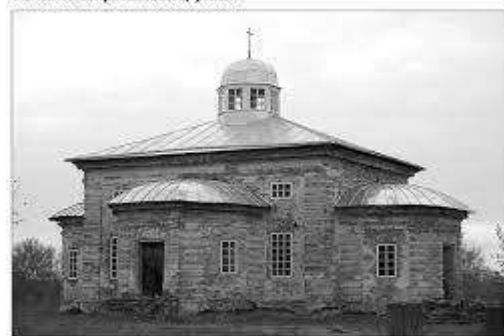
Снітин. Воскресенська церква.