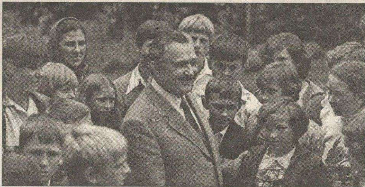
Олесь Гончар серед молоді.