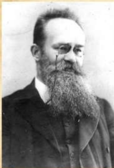
Михайло Сергійович Грушевський (1866—1934)

Сьогодні, у рік символічного збігу дат, 25-ї річниці Незалежності України і 150-річчя від народження М. Грушевського, ми знову звертаємося до політичної спадщини патріарха української державності, де він окреслив головні контури тієї Великої України, будувати яку випало на нашу долю, творити її внутрішню і зовнішню політику. Вказуючи на перспективи відродження України, духовного і економічного визволення народу, Грушевський заповідав нам передусім "знайти себе", свою стежку в світовому історичному процесі, "свою долю і свій шлях широкий".